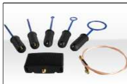
Sondas rastreadoras (Página 10)