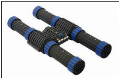
Antenas magnéticas (Página 10)