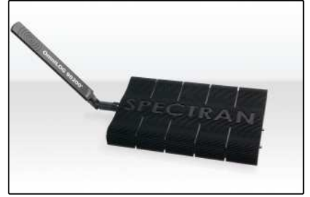
Analizadores USB (Página 4)