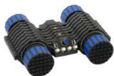
LF-2 y ELF-2