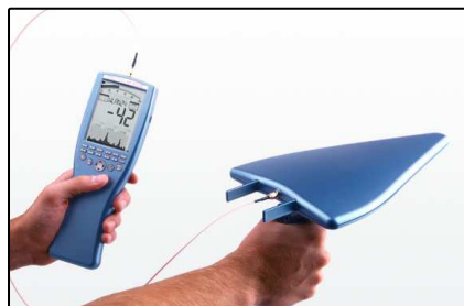
Analizadores de mano (Página 2)