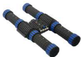
LF-6 y ELF-6