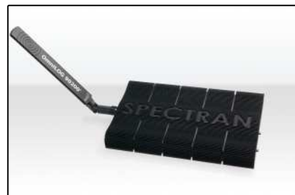
Analizadores USB (Página 4)