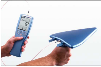
Analizadores de mano (Página 2)