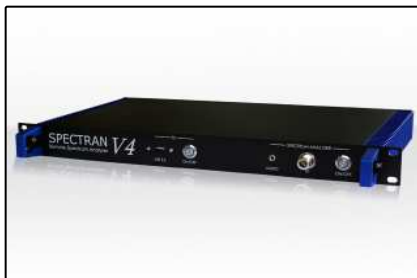
Analizadores 19" (Página 5)