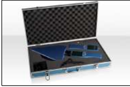
Paquetes (Página 3)