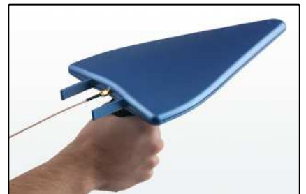
Antenas direccionales (pasivas: Página 6, activas: Página 7)