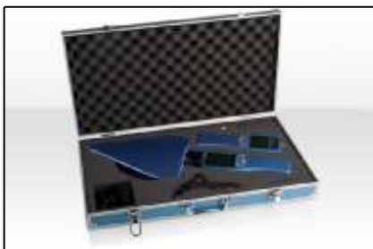
Paquetes (Página 3)