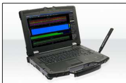
Uso exterior (Página 4)