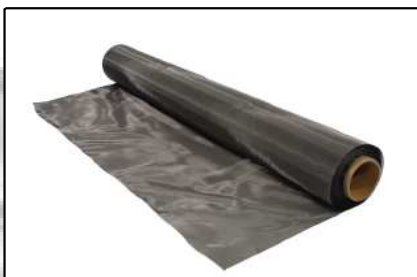
Blindaje CEM y RF (Página 12-13)