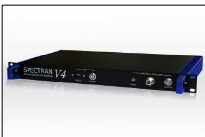
Analizadores 19" (Página 5)