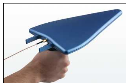
Antenas direccionales (pasivas: Página 6, activas: Página 7)