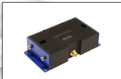
Generadores (Página 11)