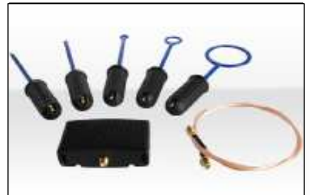
Sondas rastreadoras (Página 11)